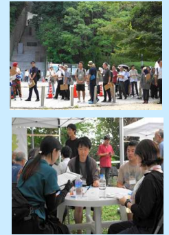
(ワークショップの様子)

開催日/令和5年12月16日(土) 14時~16時 参加人数/25名 テーマ/第3回目の未利用地の方向性を踏まえて、さらにより良くするためにはどうすれば良いでしょうか？自分たちにもできることは何でしょうか？