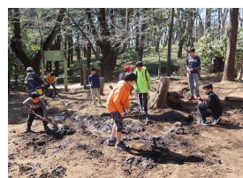
(プレイパークのイメージ)

比治山公園に関心のある方やサポーターへの参加をご検討されている方も、お気軽にお越しください！