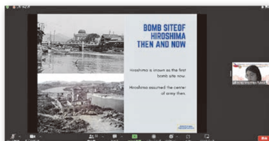
広島市からの発表