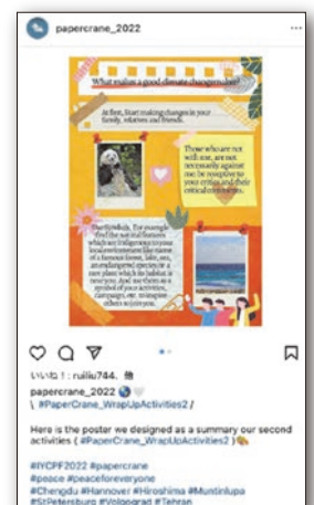
グループによるSNS発信