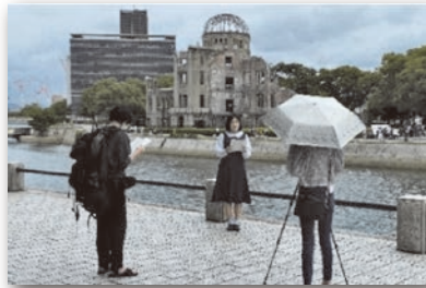
プレゼン用動画の撮影風景