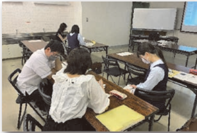
広島市プレゼンテーション 準備

オンライン会議に向けて参加者は、リーダー・副リーダーを中心に話し合いを重ね、プレゼンテーションの構成や役割分担を考え、それぞれが与えられ役割を果たすために、意欲的に準備に取り組みました。