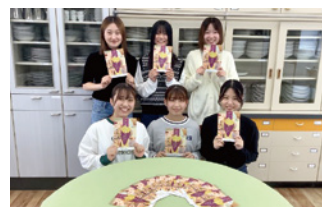
さつま芋レシピ集の完成