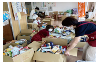
寄贈された食品のチェック・仕分け

地域づくりを目的に、全国に先駆けて、食品ロスを使用したコミュニティレストラン「まめnanレストラン」を2017年まで実施し、それ以降、イベント時にはスタッフやボランティアが食品ロスを使用した軽食を手作りし、参加者へ提供しています。※コロナ禍以降現在中止しています。等