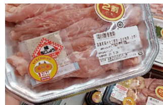
「もぐもぐチャレンジ」のシールが貼られた商品

年1回、お客さまからフードロス削減活動を推進するためのポスターを募集しています。最優秀賞作品はゆめタウン・ゆめマートのフードロス削減推進ポスターのデザインとして採用し、全店の店内掲示板上に掲示しています。等