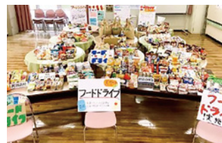
フードドライブでの回収食品

広島市内の学校の中ではいち早く「エコクッキングレシピ」の考案に取組み、地域でのエコクッキングレシピの普及を目的として公民館で親子エコクッキング教室を開催しています。等