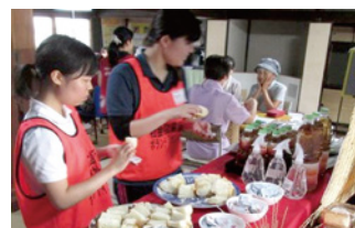
被災者等への食品ロスを使った無料レストラン