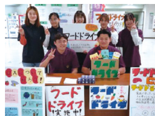
人間科学部 人間栄養学科の学生

【主な取組み】 フードドライブ活動 循環型農業の実践 親子エコクッキング教室の開催 エコクッキングレシピの考案 等