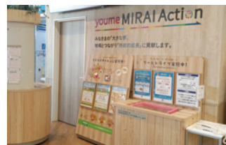
「ゆめテラス祇園」内 フードドライブコーナー