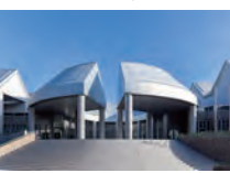
広島市現代美術館

問 現代美術館の改修内容に制約等があったのか。 答 制約や条件などは提示されておらず、既存の建築意匠を損なうことがないよう工事を行った。