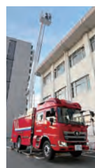
水タンク付き消防ポンプ自動車

問 技術が進歩し災害が多様化する中、令和5年度の更新では何か工夫したのか。 答 はしご車と水槽付き消防ポンプ自動車の機能を統合した車両を導入するなど、より効果的で機動力のある車両に更新した。