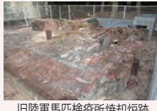
旧陸軍馬匹検疫所焼却炉跡