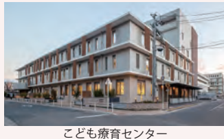
こども療育センター