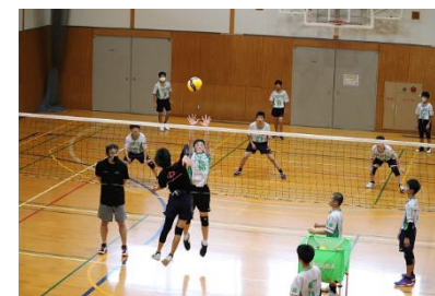
（トップス広島バレーボール学校サマー合宿）

地域をアピールするためのモデル合宿等を継続しつつ、合宿・アクティビティ等のパッケージ化や、問い合わせ対応のワンストップ化により合宿誘致を本格的に進めていきます。また、合宿地として選ばれるために、湯来体育館に空調機の新設導入やトレーニング室のウエイト器具の補充、湯来南運動広場に少年サッカーや野球等で利用できる人工芝の整備などのスポーツ施設の整備にも取り組んでいきます。