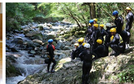
（地域の自然を活用したアクティビティ）