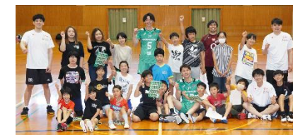
（JTサンダース広島及び広島ドラゴンフライズの選手による合同スポーツ教室）