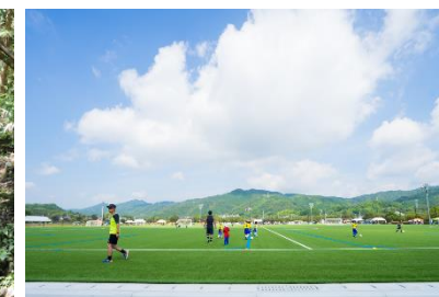
（人工芝グラウンドの整備イメージ）