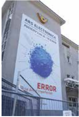
▲Post City 会場

2018年9月6日から10日にオーストリアのリンツにてアルスエレクトロニカ・フェスティバルが行われました。この祭典は1986年から毎年行われ、世界最先端のメディア芸術を鑑賞、体感することができる国際展です。