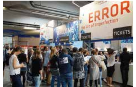
▲展覧会の様子(左・中央)、入り口付近の様子(右)