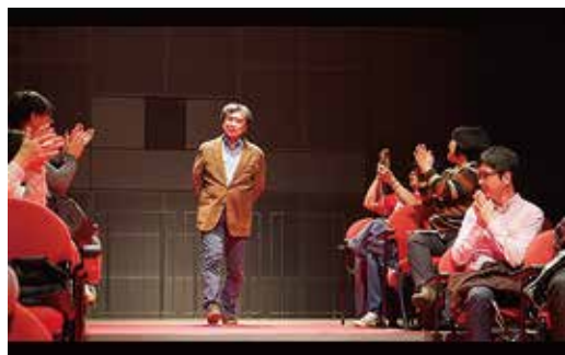
▲レッドカーペットを歩く監督