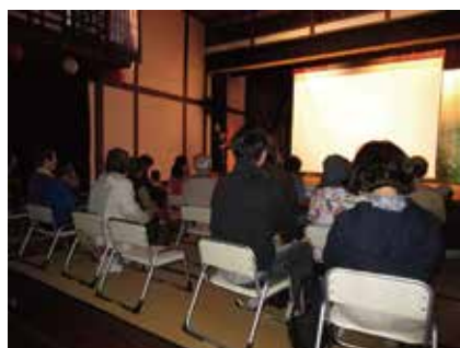
◀▼会場の様子 （左：乙女座、下：県立美術館）

国際アニメーション・デーは、フランスのエミール・レイノーが1892年に世界ではじめてアニメーションを一般公開したとされる10月28日を記念し、国際アニメーションフィルム協会（ASIFA、本部：フランス・ヌメシー市）がアニメーションアートの普及と発展を目的として定めました。同協会では、2002年から各国のASIFA支部を中心に毎年10月28日およびその前後に世界中で“同時”にアニメーションの催しを行う企画を展開しています。日本でもASIFA日本支部（ASIFA-JAPAN）が主体となって、2005年からこの企画に参加しています。