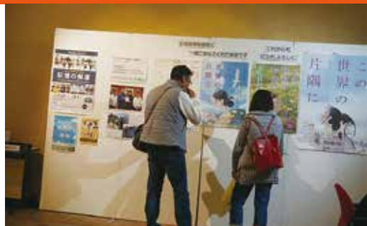
▲歴代ポスター展示