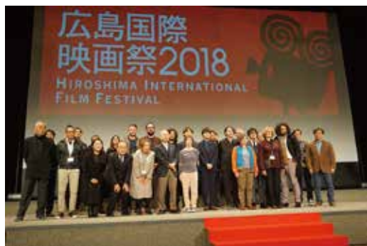
▲映画祭の多彩なゲスト