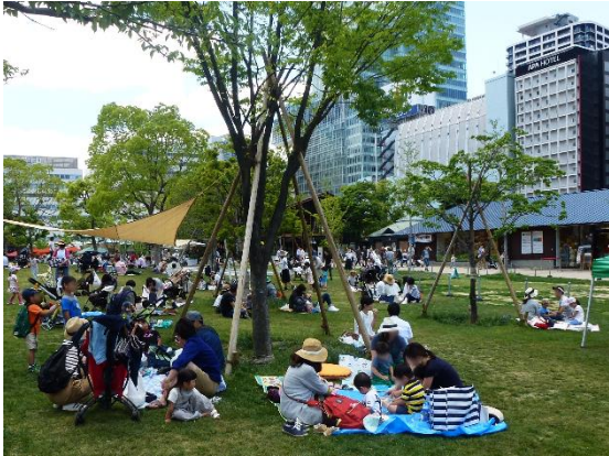
(大阪天王寺公園 “てんしば” )