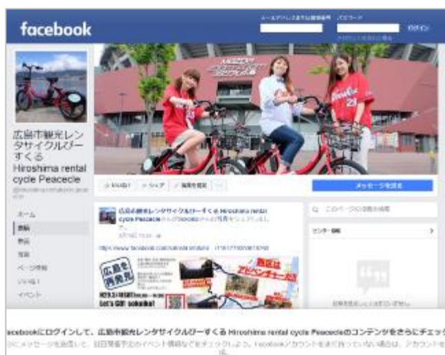
《SNS を活用した情報発信》