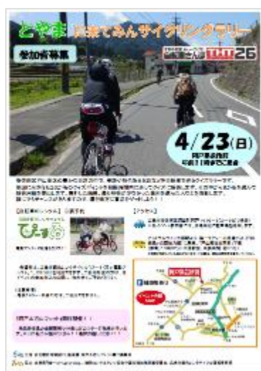
《サイクリングイベント（安佐南区戸山）での貸出》

平成29年度は、サイクルポートを34箇所まで増設したほか、イベントでの貸出、SNSを活用した情報発信などにも取り組んだ。