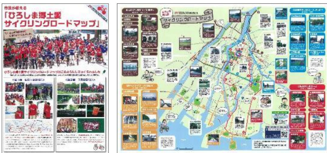
《市民が考える ひろしま郷土愛サイクリングロードマップ ((一社) 広島青年会議所)》

(一社) 広島青年会議所の「市民が考える ひろしま郷土愛サイクリングロードマップ」の作成に協力を行った。