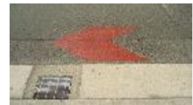
《矢羽根型路面標示》