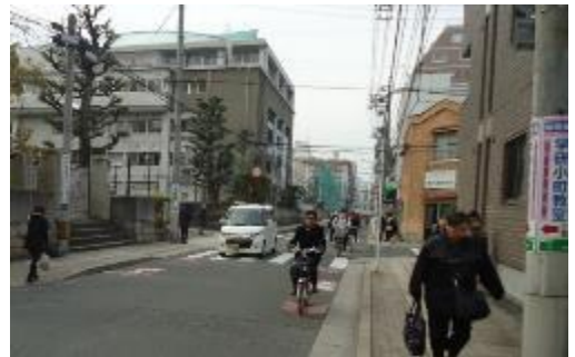
《整備状況 (中 1 区 254 号線)》