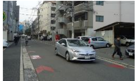
《整備状況 (中 1 区 271 号線)》