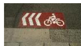
《自転車ピクトグラム》