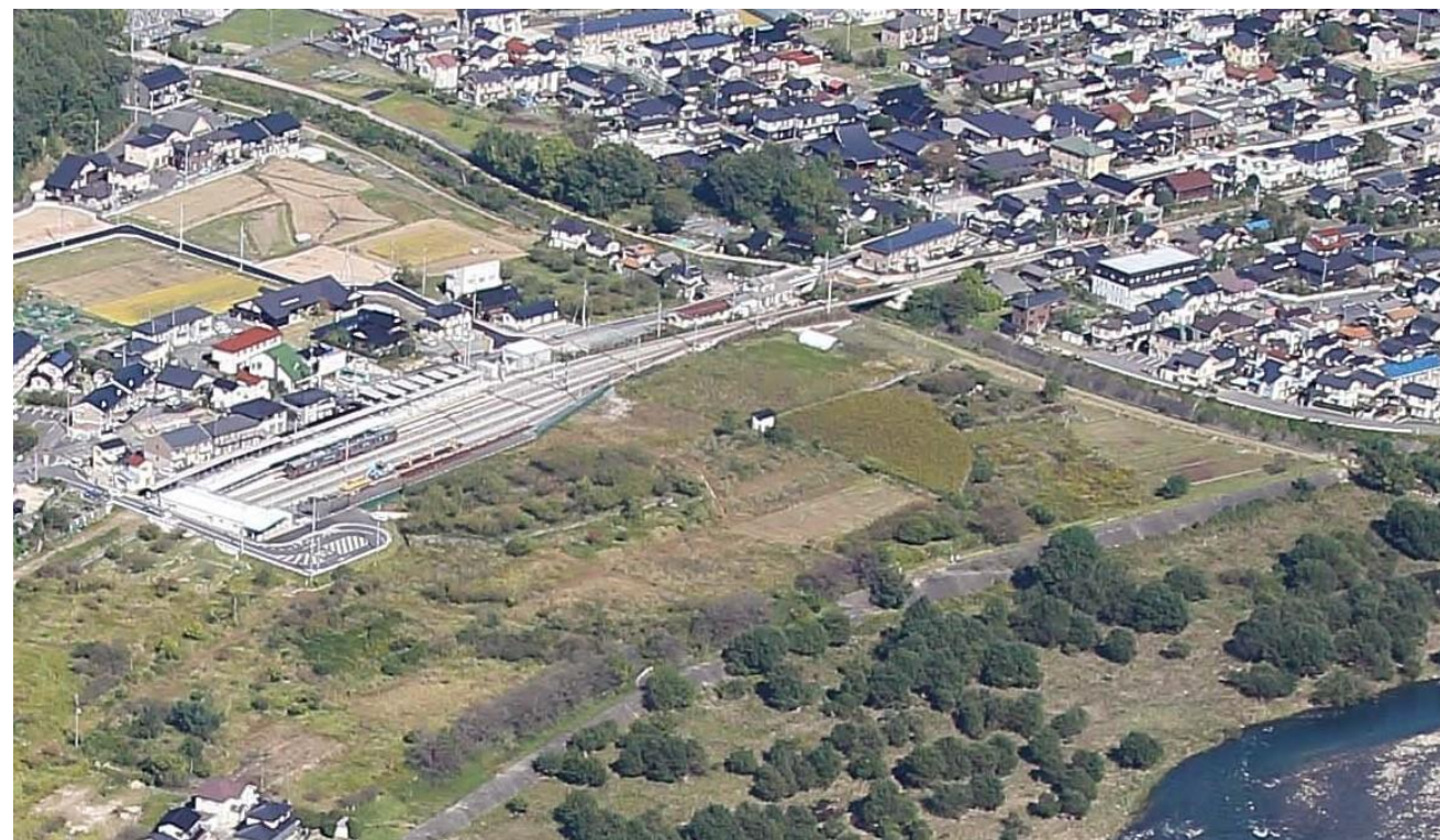
土地区画整理事業の造成工事前