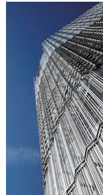
写真提供／黒住 直臣

●所在地／中区三川町7番1号 ●施主／医療法人社団秋月会 香月産婦人科 ●設計者／株式会社三菱地所設計 ●施工者／鹿島建設株式会社 中国支店 ●概要／有床診療所・無床診療所・物販店舗・飲食店舗 SRC造 地下1階・地上9階建て 建築面積：439.48㎡ 延床面積：4,249.40㎡ ●完成時期／平成30年4月