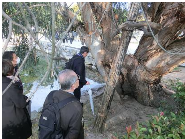
広島城内の被爆樹木