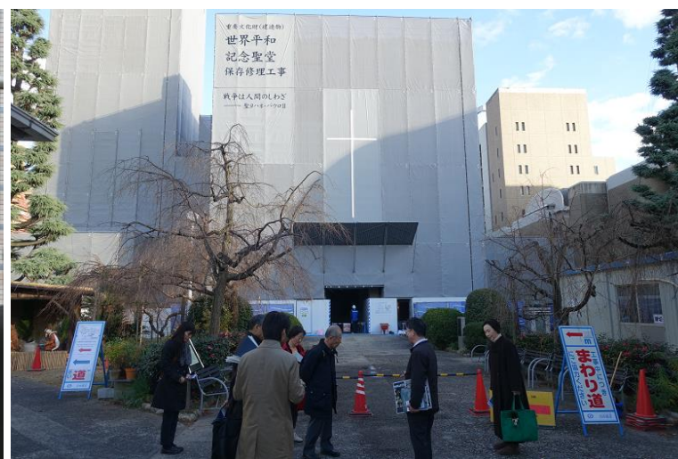
世界平和記念聖堂