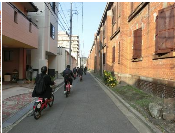
旧広島陸軍被服支廠