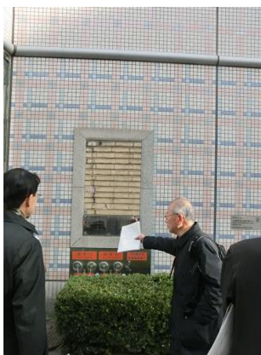
旧キンビアホール外壁