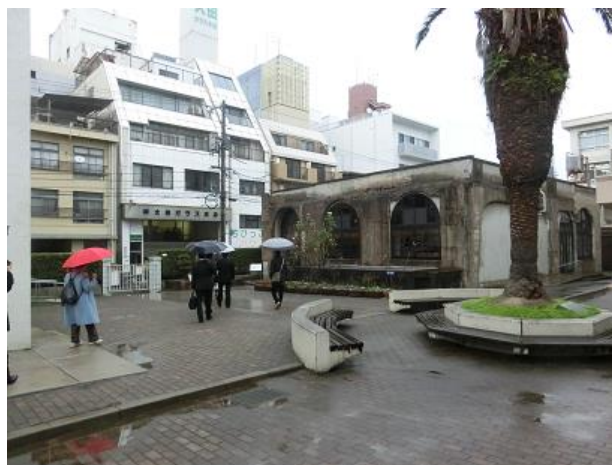
本川小学校平和資料館(外観)