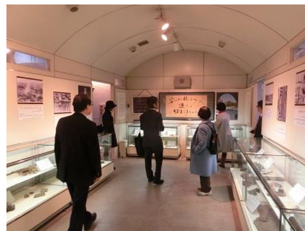
本川小学校平和資料館(内部)