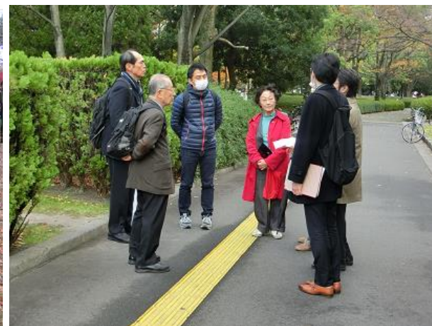
途中での意見交換