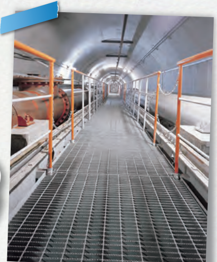
グレーチングの国内シェア1位 (株ダイクレ・呉市)