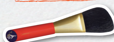
化粧筆国内生産本数及び売上首位 (株白鳳堂・熊野町)