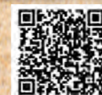
けん玉発祥の地 (廿日市市)