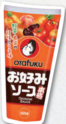
お好みソース生産量NO.1 (オタフクソース㈱・広島市)