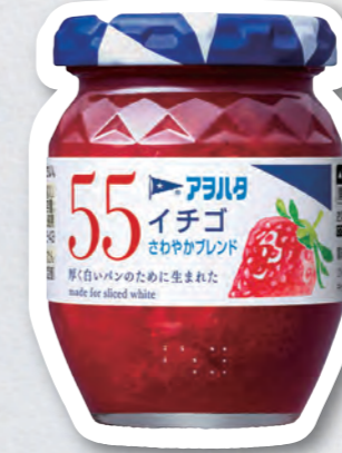
低糖度ジャムシェアNO.1 (アヲハタ㈱・竹原市)