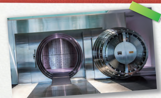
金融機関向け金庫室シェアNO.1 (株熊平製作所・広島市)