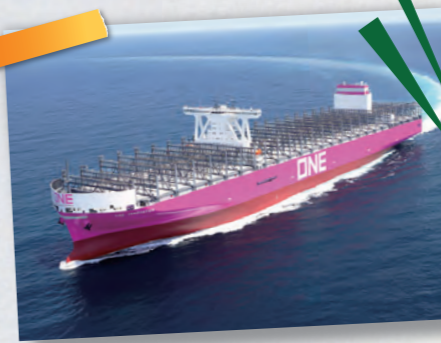
2万4千個積み世界最大級のコンテナ船 "ONE INNOVATION" (ジャパンマリンユナイテッド㈱・呉市)