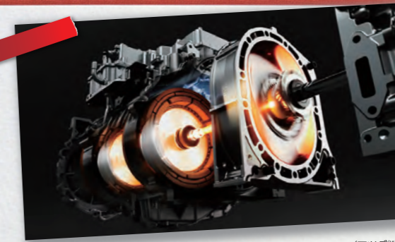
MAZDA CX-80 文部科学大臣表彰の「科学技術賞」を受賞 -モデルベースリサーチを活用した断熱吸音部材の開発が対象- (マツダ㈱・府中町)

呉市/竹原市/三原市/大竹市/三次市 東広島市/廿日市市/安芸高田市/江田島市 府中町/海田町/熊野町/坂町 安芸太田町/北広島町/大崎上島町/世羅町 岩国市/柳井市/周防大島町/和木町 上関町/田布施町/平生町 浜田市/美郷町/邑南町/飯南町 川本町/出雲市/益田市/吉賀町