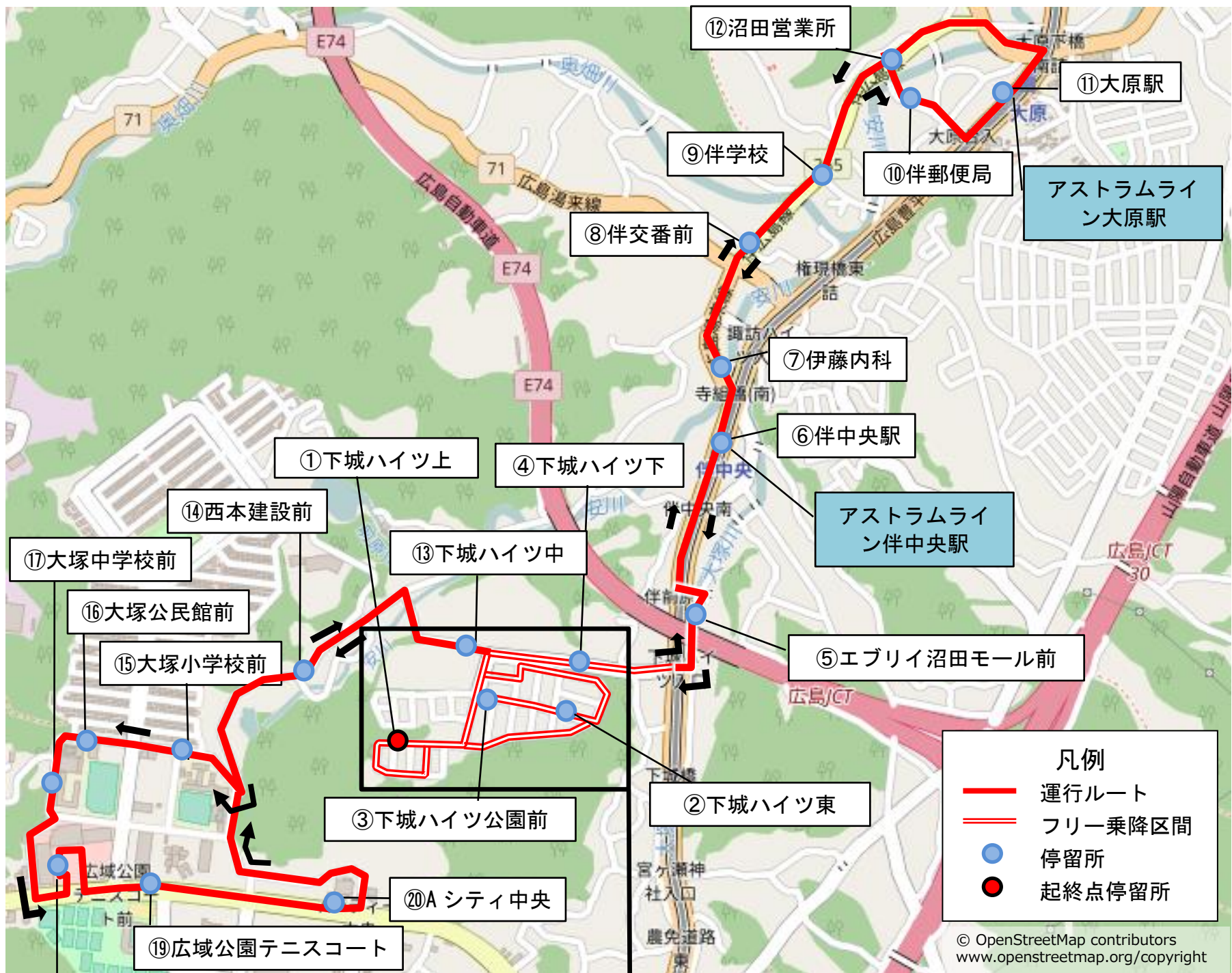
下城ハイツ拡大図