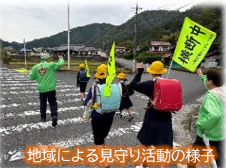
地域による見守り活動の様子