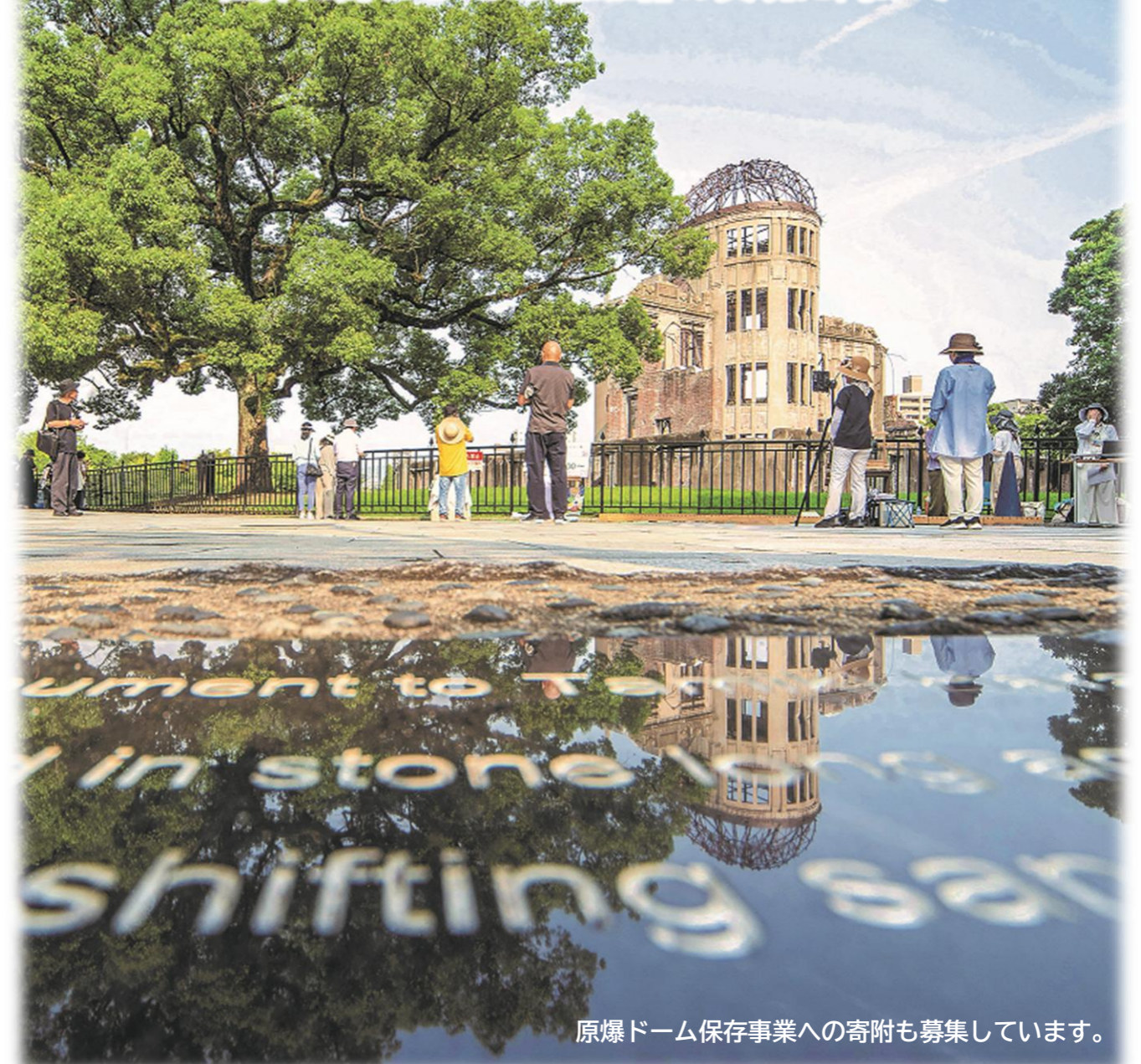
原爆ドーム保存事業への寄附も募集しています。

世界最初の被爆都市であり、廃墟から立ち直った広島市は、このまちを築き上げてきた先人の努力を受け継ぎ、将来にわたって魅力あふれるまちであり続けられるよう、「世界に誇れる『まち』広島」の実現に向け、地方創生に取り組んでいます。