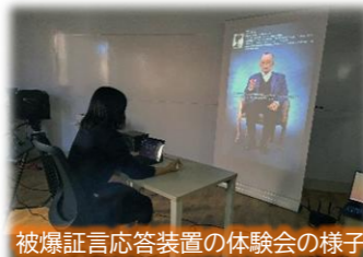
被爆証言応答装置の体験会の様子

今後、確実に到来する「被爆者がいなくなる時代」を見据え、被爆者の言葉や思いを確実に後世へと伝えるため、AIを活用した「被爆証言応答装置」の運用や、原爆関連資料の検索システムの構築のほか、原爆投下時の悲惨さを疑似体験できるVRゴーグルの活用を図ります。