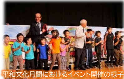
平和文化月間におけるイベント開催の様子

市の基本計画及び平和首長会議の「持続可能な世界に向けた平和的な変革のためのビジョン(PX ビジョン)」において目標の一つに掲げている「平和文化の振興」に取り組むため、平和文化月間(11月)の認知度の向上と、参加者の平和意識の一層の高揚を図るほか、「平和文化の振興」に関する冊子の配布などを行います。