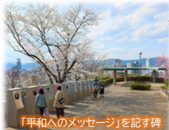
「平和へのメッセージ」を記す碑

比治山公園は、その標高を生かして、原爆の惨禍から復興した都心の街並みを一望できます。こうした特性を生かして、「国際平和文化都市として復興した広島」の「今」を実感できる新たな拠点として再整備を進めています。