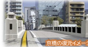
京橋の復元イメージ

西国街道をより一層歴史を感じることができる通りとし、市民や来訪者がまちの歴史に思いを巡らせ、平和について考えるきっかけとするため、広島市の復興を見届けてきた被爆橋の一つである京橋を、架設当時の姿である青銅製に復元します。