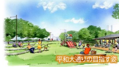
平和大通りの目指す姿

平和記念公園の南側に位置し、本市を代表するシンボリックな通りである平和大通りを、人々に平和を実感してもらう空間、また、都心の回遊を促す新たなにぎわいを生み出す空間にしていいため、平和大通りの魅力や価値を高める整備及び利活用の取組を進めます。