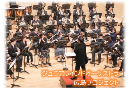
ジュニアウインドオーケストラ 広島プロジェクト

文化芸術活動の活性化や平和文化の振興を図るため、音楽、メディア芸術やストリートダンス等の様々なイベントを行う「ひろしま国際平和文化祭」を隔年で開催しています。また、アカデミー事業として毎年、中高生を対象とした音楽教育プログラム「ジュニアウインドオーケストラ広島プロジェクト」等を実施しています。