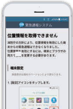
いちじょうほう オフ とき 位置情報がOFFの時 ひょうじ がめん に表示される画面