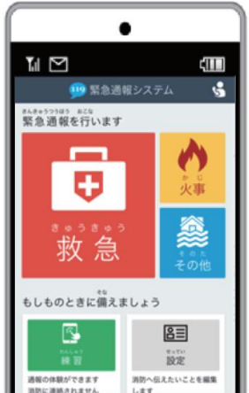
つうほうがめん ガラホの通報画面

ひだり す つうほうがめん ひょうじ ばあい 左の図の通報画面が表示された場合は「ガラホ」なので ちゅうい 注意してください。