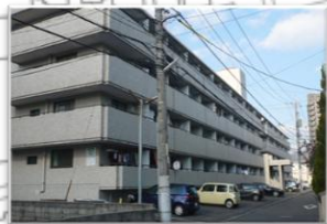
中田ビル西原駐車場