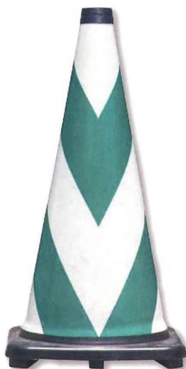
ブライトラバーコーン 緑／白 ゼブラ