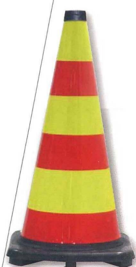
レモンイエロー/赤 横段