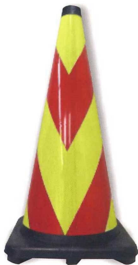
レモンイエロー/赤 ゼブラ