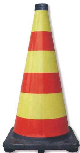
ブライトラバーコーン レモンイエロー／赤 横段