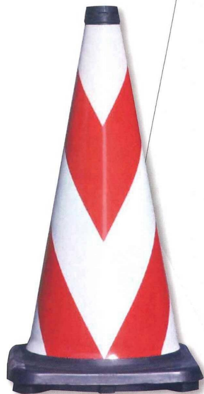
ブライトラバーコーン 赤／白 ゼブラ