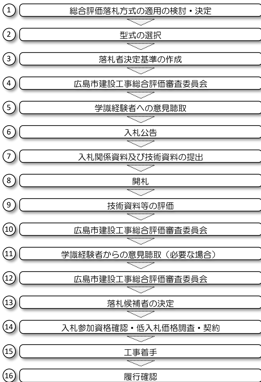
図－1 総合評価落札方式の実施手順