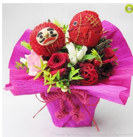
例：三原市のだるま×花