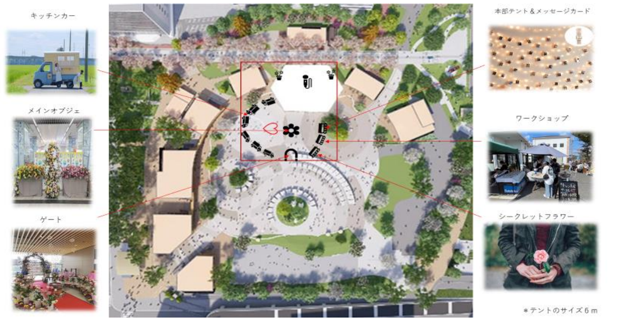
配置図 (パターン 1)