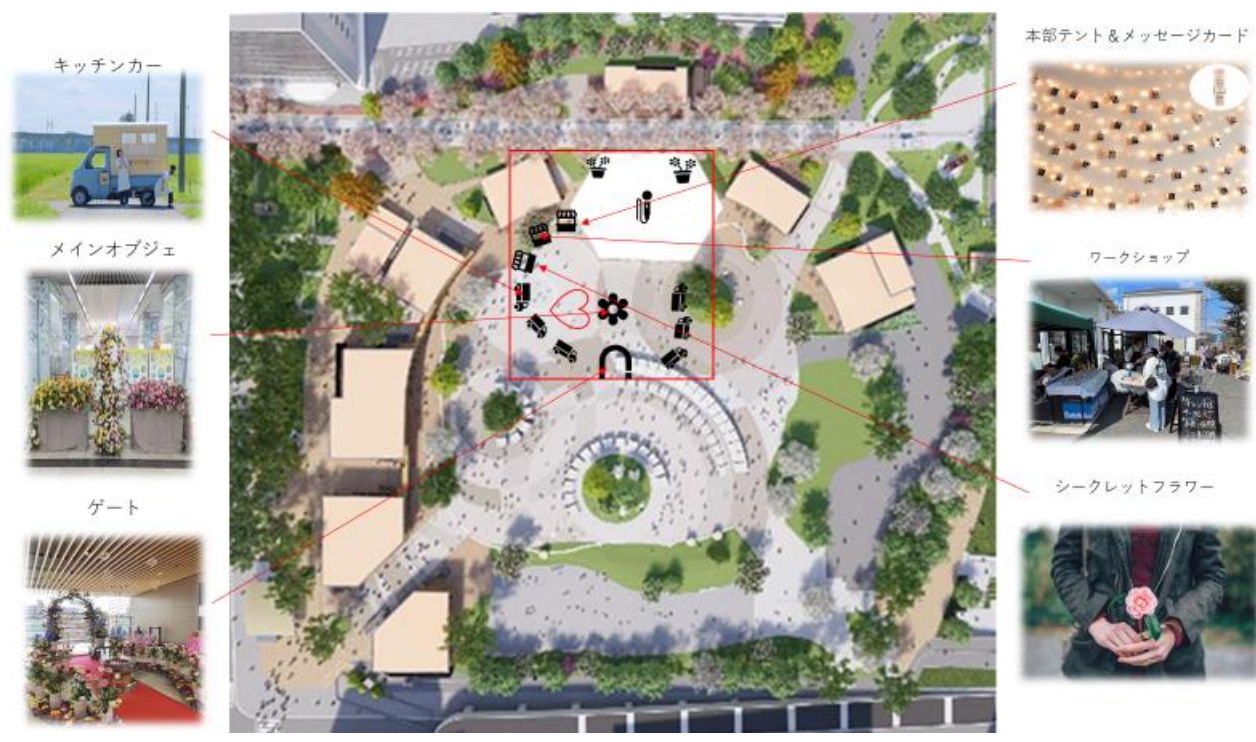
配置図 (パターン 2)

会場図 : https://gate-park.jp/wp/wp-content/themes/shiminto_Template/document/download/drawingall.pdf