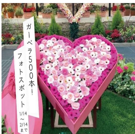
例：市花・市のイメージカラー