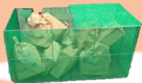
ごみ収集枠（折り畳み式）