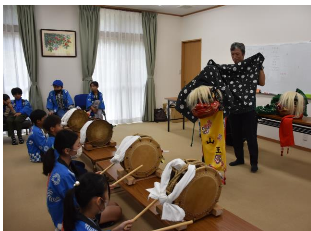
区の魅力と活力向上推進事業補助金を活用して実施した「山王獅子舞」