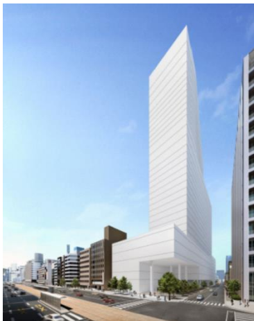
外観完成イメージパース

今後とも、引き続き本事業の早期実施に向けて、関係者一丸となり、着実に推進してまいります。