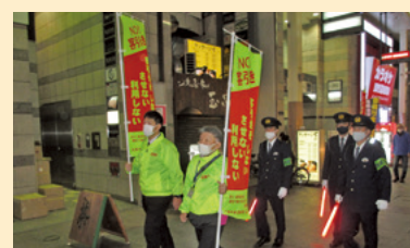
流川環境浄化活動「リパークリーン作戦」