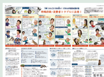
市民と市政令和2年12月15日号 特殊詐欺・消費者トラブルに注意!