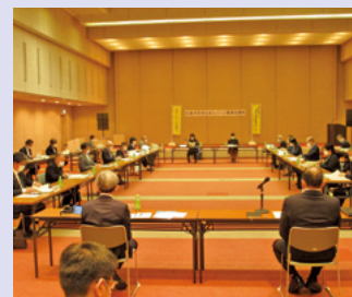
安全なまちづくり推進協議会