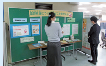
区役所展示（犯罪被害者等支援広報）