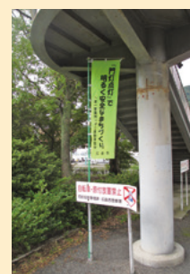
一家一事業所一点灯運動のぼり旗