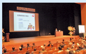
「減らそう犯罪」区民大会