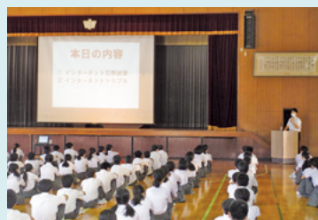
犯罪被害等防止教室