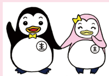
更生ペンギンのホゴちゃんとサラちゃん