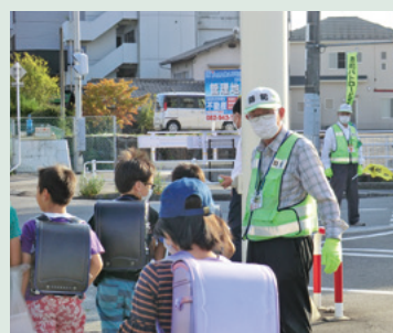
地域の見守り活動