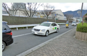
青色防犯パトロール活動