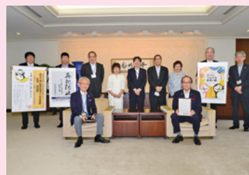
第70回「社会を明るくする運動」 内閣総理大臣メッセージの伝達式