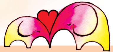
マスコットキャラクター ハナ & ミミ