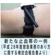
新たな止血帯の一例 (平成28年度救急業務のあり方に関する検討会報告書より)

答 同授賞式は、「核兵器のない世界」の実現が平和な世界の実現に欠かせないものであることを広く世界中の人々に知ってもらおう絶好の機会になると思っている。また、核抑止力が世界の平和の実現に有効であるという考え方の下に展開されている国際政治に一石を投じるものもある。授賞式へ招待されたことは、大変光栄なことであり、広島・長崎両市に対する今後のさらなる取り組みへの期待の表れであると受け止めている。