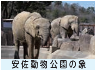
安佐動物公園の象

答 安佐動物公園では、これまで、国内はもとより、ホルル市等の動物園との間で動物を平和の架け橋として交換し、都市間の交流を重ねてきた。また27年度から折り鶴再生紙を利用した動物折り紙教室を開催している。今後も、こうした取り組みに加え新たな取り組みを取り組むを検討し、平和を象徴する存在としての動物公園の役割を果たしていきたい。