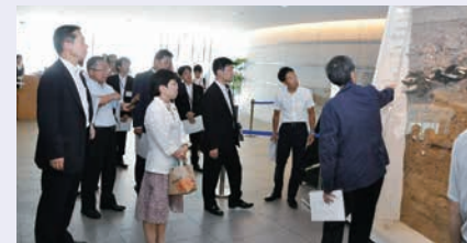
国立広島原爆死没者追悼平和祈念館視察 (7/28)