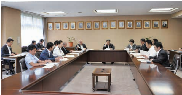
6月定例会について協議する議会運営委員会のメンバー (5/19)

円滑な議会の運営を期すため、議会運営の全般について協議し、意見調整を図る場として設置された委員会です。