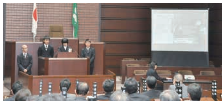
高校生による提案発表会の様子 (11/6)

議会改革の推進に関し、協議または調整を行う会議です。 平成 29 年 3 月には、平成 28 年度までの活動をまとめた中間報告を議長に提出しました。 4 月以降も、選挙公報や議員定数等について、活発に議論したほか、11 月には、高校生に政治や行政への関心を高めてもらうことなどを目的に、市立高等学校の生徒による市議会への提案発表会を実施しました。