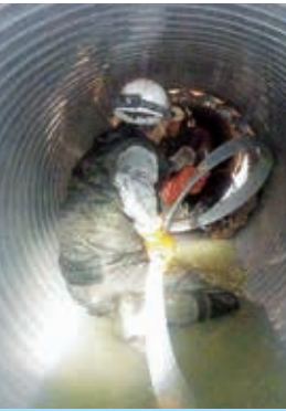
宇品地区管更生施工中

●児童生徒の学力向上のため、ひろしま型カリキュラム等本市独自の取り組みのさらなる充実・拡充に努めること。