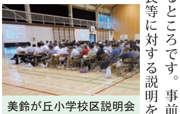
美鈴が丘小学校区説明会

答 市としては、県主催の説明 会であっても出席し、指定後の 警戒避難体制の整備が円滑に 進められるように説明を行っ てきているところです。事前 に町内会長等に対する説明を 行うことについて、 県に働きか けていき たいと考 えています。