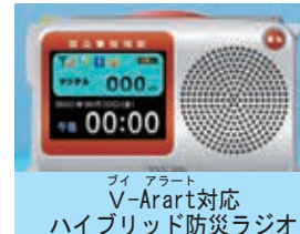
V-Arart対応ハイブリッド防災ラジオ

ご提案のV・L・O・Wは、音声や文字情報を地域限定で発信できるなど有効な機能を備えたシステムです。今後この活用について調査・研究するとともに、民間サービスを取り入れながら、多様な情報媒体から防災情報入手できる効果的な情報伝達手段について、民間事業者への支援も含め、幅広く検討していきます。