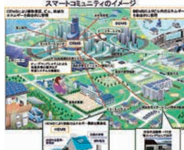
スマートコミュニティのイメージ

温室効果ガス排出量を大幅に削減するためには、環境に配慮したライフスタイルやビジネススタイルへ転換することが重要であり、市