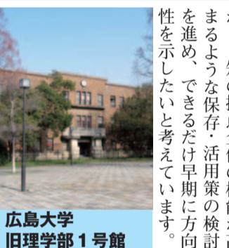
広島大学 旧理学部1号館

同館の保存・活用にはかかる等の課題もありません。今後、他都市の事例を参考にし、市民・有識者のご意見も聞きながら、知の拠点全体の機能が向上するよう保存・活用策の検討を進め、できるだけ早期に方向性を示したいと考えています。