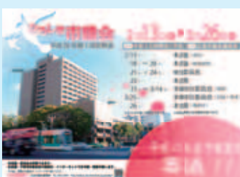
▲平成26年第1回定例会開催案内ポスター

本会議がいつ行われているかということの周知を図るために、定例会のポスターを制作し、議会日程のPRに努めることにしました。