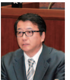
恒知 恒知 市民連合 (南区)

サービスの上昇を図るための取り組みを進めています。また、公施設整備については、本市の財政状況や人口構成の変化を踏まえれば、公施設規模や機能を維持したままの更新は現実的ではありません。このため、すでに公施設老朽化対策検討会議を設置し、対策の検討を進めています。ハコモノ資産の現状調査によって見えてきた課題に対応し、市民の求めるサービスの提供を充実に行うためには、施設の多機能化や広域利用などの検討も必要だと考えています。今後は、ハコモノ資産の現状をまとめた「広島市ハコモノ白書」を1月に公表し、26年度には、「更新に関する基本方針」を策定する予定です。