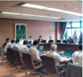
公共施設老朽化対策 検討会議の様子

サービスの上昇を図るための取り組みを進めています。また、公施設整備については、本市の財政状況や人口構成の変化を踏まえれば、公施設規模や機能を維持したままの更新は現実的ではありません。このため、すでに公施設老朽化対策検討会議を設置し、対策の検討を進めています。ハコモノ資産の現状調査によって見えてきた課題に対応し、市民の求めるサービスの提供を充実に行うためには、施設の多機能化や広域利用などの検討も必要だと考えています。今後は、ハコモノ資産の現状をまとめた「広島市ハコモノ白書」を1月に公表し、26年度には、「更新に関する基本方針」を策定する予定です。