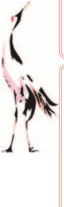
千田町夜間急病センター

自民党・保守クラブ 問 コスト高の最大原因となっている3人乗車の廃止時期はいつか。 答 職員用の退職は合わせて、この1、2年でなくとも見込められている。 問 行財政改革の観点から直営を廃止し、委託化の推進が必要と思うがどうか。 答 本市の処理責任を踏まえ、行政的要素の少ない業務を中心に、職員の出向も考慮しながら委託化を推進していく。 問 現業職員の配置転換を検討する必要があると思うがどうか。 答 町内清掃や不法投棄の対応などの業務にシフトしていくことも検討項目であると考えている。 問 委託業務の入札制度は改善が必要だと思うがどうか。 答 入札制度の改善は重要な課題であると考えており、現行制度の課題の本質を押さえ、どのような対策がとれるのか検討していきたい。