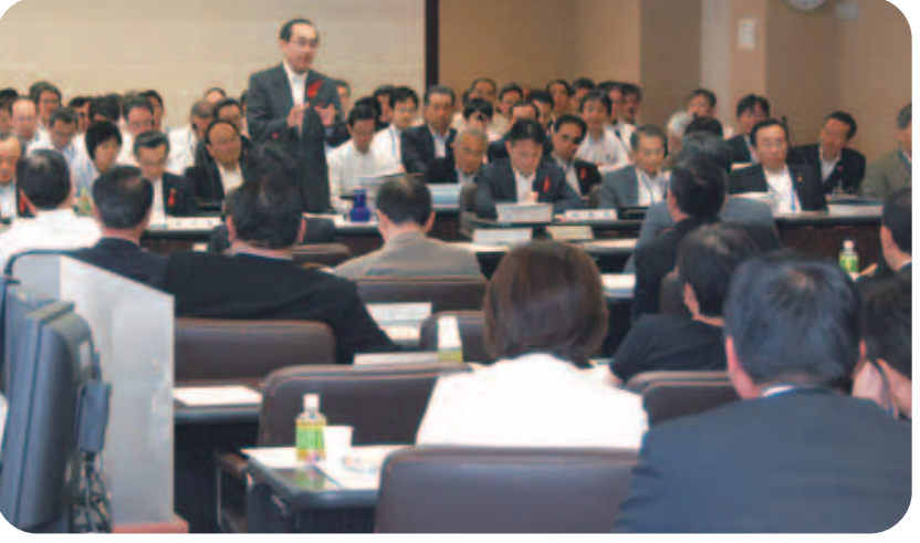
総括質疑で答弁する市長