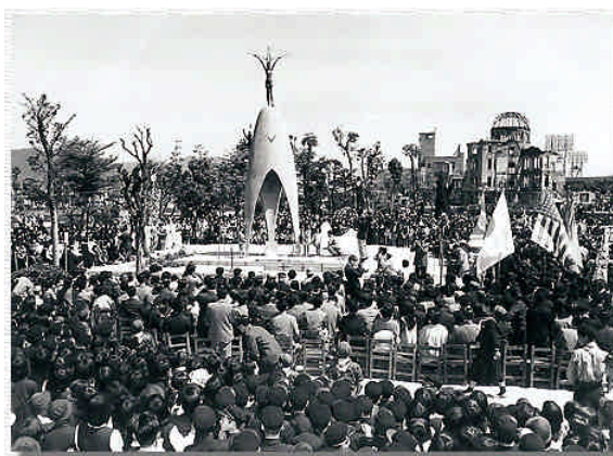
原爆の子の像(除幕式)