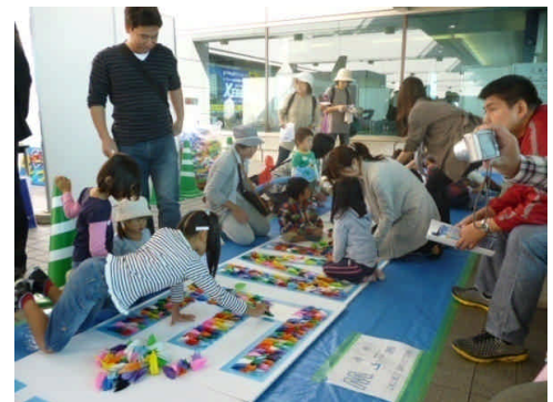
折り鶴ウェルカムボード制作イベント

広島らしい平和への願いと県民の手作りによる温かいお出迎えをコンセプトとする事業として、マスコミによる取材・報道が数多く行われるなど、平和の思いを広く発信する有意義な取組であったものと考えられます。