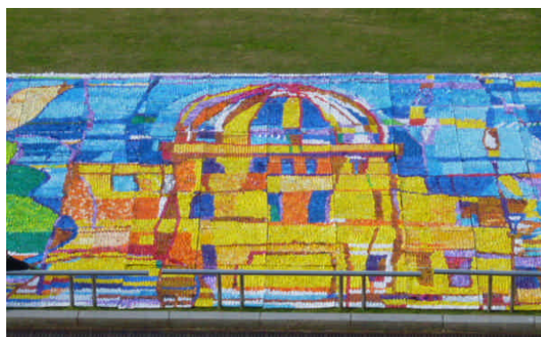
モザイクアート(原爆ドーム)を完成し平和記念公園芝生広場に展示