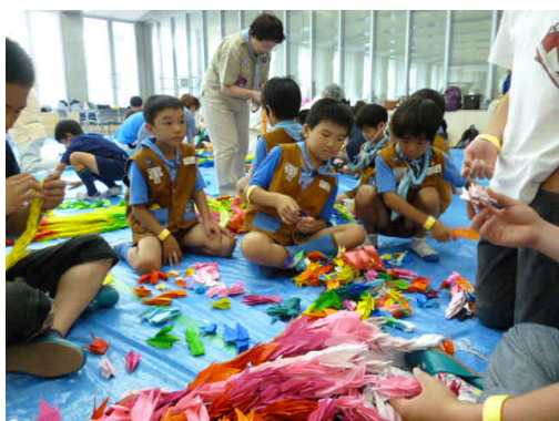
市民参加による折り鶴解体・選別作業