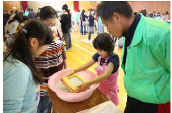
紙すきによるハガキ作り