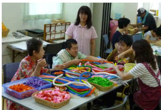
障害者就労支援施設での千羽鶴の解体・選別作業