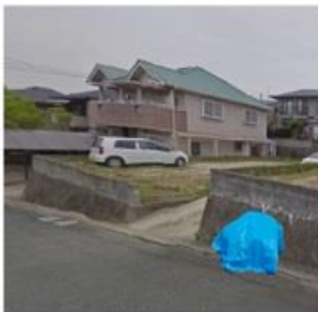
ごみステーションの現況 (ごみが写っているもの)