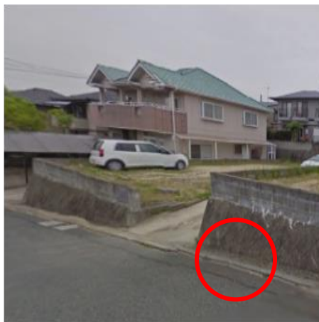
管理用具を使用する場所

(3) 管理用具を使用する場所の写真(ごみ収集枠の場合は、使用時に伸縮部分が道路を一時的に使用する幅と歩道及び車道の確保できる有効幅員が明確に写っているもの)