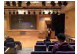
会場の様子(合人社ウェンディひとまちプラザ)

世界の優れたアニメーション作品を紹介する「国際アニメーション・デー 2016 in 広島」が広島国際アニメーションフェスティバル実行委員会等の主催（ASIFA-JAPAN 共催）により、10月から11月にかけて、横川シネマ（10月22日）、広島市映像文化ライブラリー（10月28日）、広島市現代美術館（10月29日）、道の駅たけはら（11月5日）、合人社ウェンディひとまちプラザ（11月8日）の5会場で開催されました。過去の広島国際アニメーションフェスティバル受賞作品およびコンペティションの中から選りすぐりの作品に、参加した多くの観客が魅了されました。