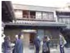
竹原の街並みを散策しながらの交流

2005年から開催されているこの上映会。今回は初めて竹原市でも行われました。地元竹原で映像文化や地域振興に関心のある方々も多く参加されました。上映会終了後は、広島市方面からの参加者と一緒に、会場の「道の駅たけはら」から町並み保存地区周辺を散策しながら交流を行いました。