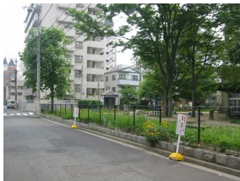
○ 見通しのよい構造のフェンスを設置した公園