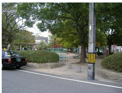
○ 必要に応じて照明灯の増設を検討する