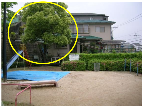
○ 周囲の住宅からの見通しを確保する（剪定前）