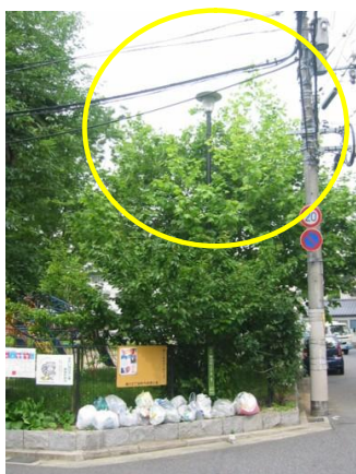
○ 照明灯の光を遮る枝葉の剪定を行う（剪定前）