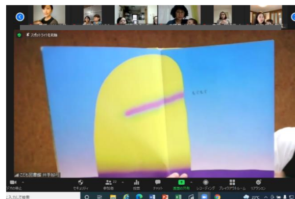
図書館司書さんの「絵本の楽しみ方」