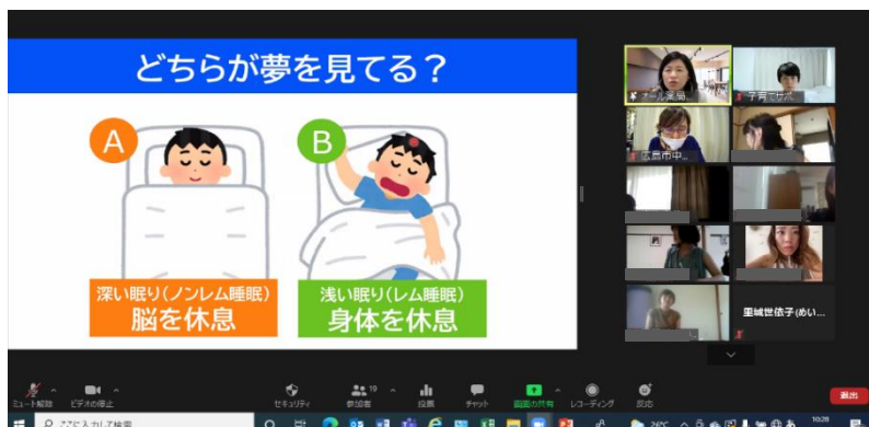
上級睡眠健康指導士さんの「睡眠のはなし」

公民館の新たな利用層にアプローチできる 多様な学習者のニーズに応えることができる