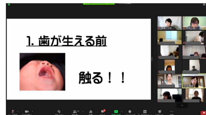
歯医者さんの「子どものお口の育て方」