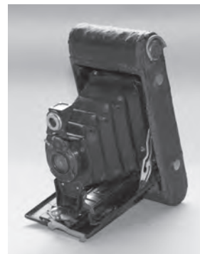
折りたたみ式カメラ