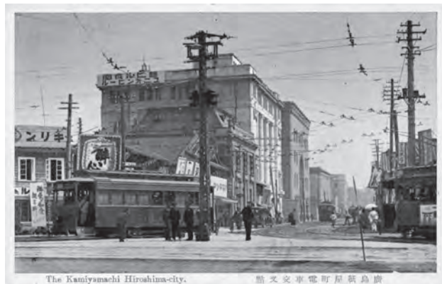
絵葉書「広島紙屋町電車交差点」