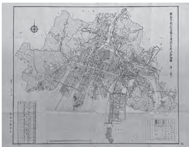
「広島平和記念都市建設計画街路網公園緑地図」