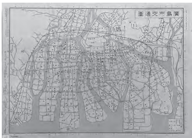
「最新広島市交通図」